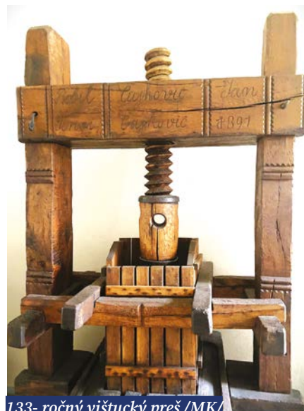
133-ročný vištucký preš /MK/