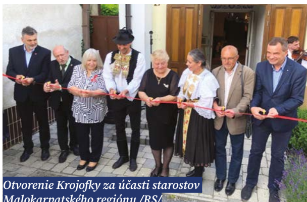
Otvorenie Krojofky za účasti starostov Malokarpatského regiónu /RS/