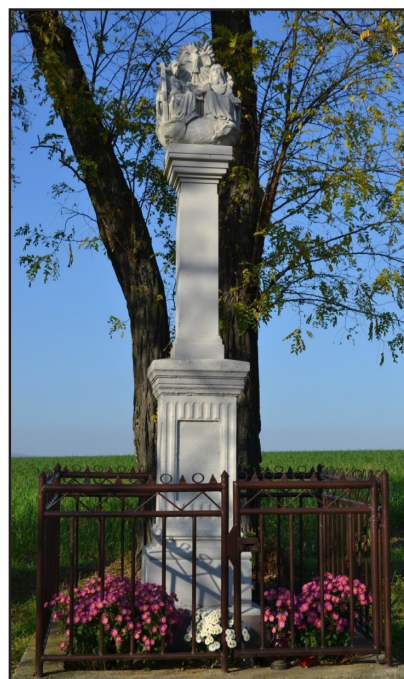
Božia muka – Trojička

Zo súčasných hraničných múk, ktoré stoja pri vstupoch do obce, sú toto všetky, no v ďalšom čísle som si pre vás pripravila históriu sôch – či už je to sv. Florián, Vendelín, alebo Ján Nepomucký. Určite ich dobre poznáte. Veď k viacerým sa viažu tradície počas veľkonočných sviatkov, iné zas vybudovali ako poďakovanie za záchranu. Tak si na ich príbeh počkajte v ďalšom čísle.