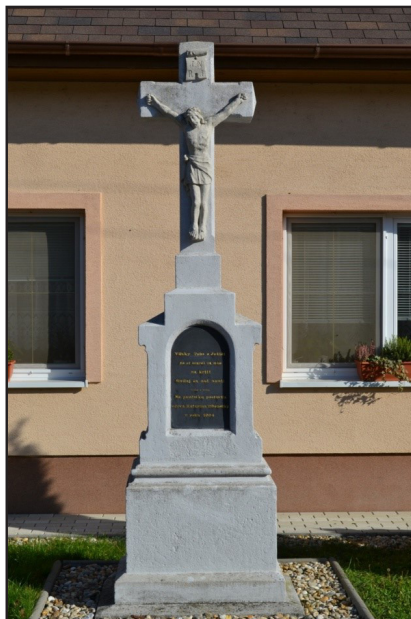
Muka na ceste smerom do Modry

V kruhu, na mape z roku 1938, je vyznačená 3 metre vysoká Božia muka – Trojička. Nachádza sa pri ceste vedúcej z Vištuka do Báhoňa. Betónové súsošie s podstavcom a s podobizňou Otca, Syna