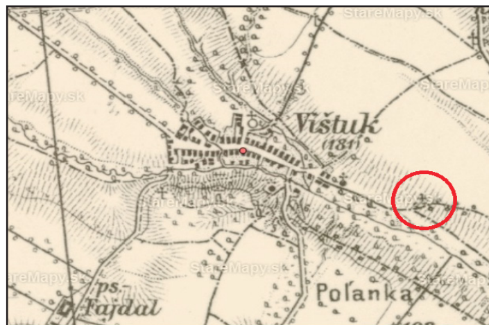
V kruhu vyznačená božia muka – Trojička na ceste z Vištuka do Báhoňa