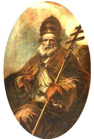
Svätý Lev Veľký, pápež a učiteľ Cirkvi 440-461

Keď pôjdeš na cintorín, pozri si aj nápisy na hrobách. Hovoria o pravde, alebo je to len prázdne klišé? Sú tie náhrobné kamene nemou úctou, alebo nemou pravdou? Keď zomrieš, bude nápis na tvojom hrobe pravdivý, alebo budeš s hanbou písať do blata niečo iné? Amen.