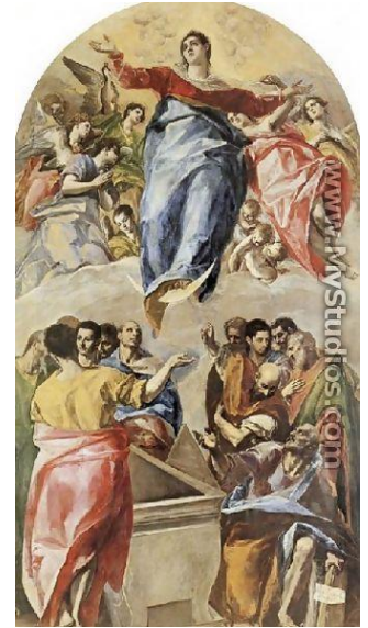
Nanebovzatie Panny Márie El Greco-1577

Predstavme si ešte raz, že by sme mali písať knihu svojich spomienok. Čo by sme napísali do kapitoly: Búrky v mojom živote? My, kresťania, by sme mali napísať, že všetky búrky sme prežili, lebo sme sa nebáli vpadnúť do náručia nášho nebeského Otca a počúvať hlas jeho Syna Ježiša.