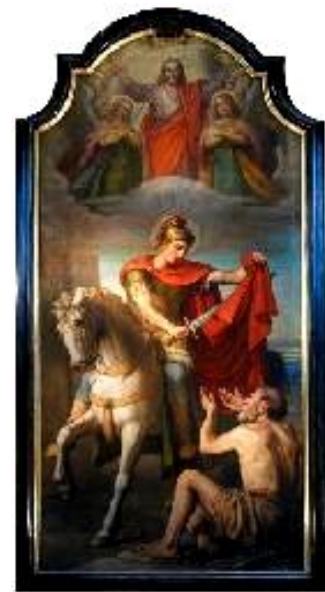
Oltárny obraz v kostole Svätého Martina v Třebíči

Dokážme na cintoríne nielen smútiť a plakať, ale sa aj radovať. Naša viera nám to umožňuje.