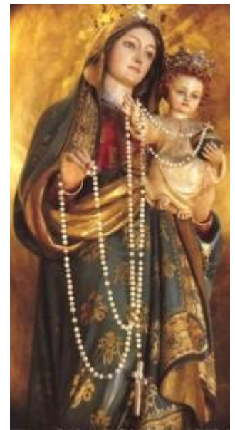
Ružencová Panna Mária

Preto prosíme i my našu Nebeskú Matku, aby nás stále ochraňovala a vyučovala nás, aby sme boli poslušní a verní jej Synovi, nášmu Pánovi Ježišovi Kristovi.