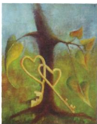
Ján Suchán „Otče náš“