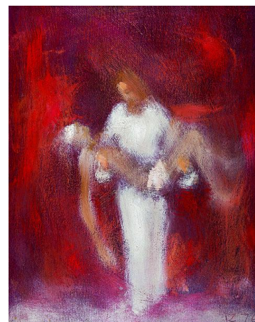
Záborský 1395: Najväčší milosrdný samaritán

Nebojme sa ani my prijať do svojho života pseudonym – Samaritán.