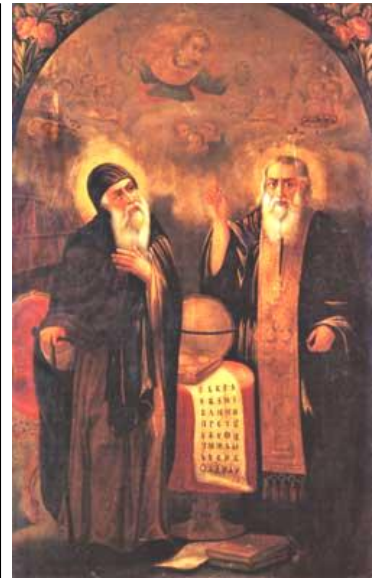
Stanislav Dospevsky (1823-1878) Cyril a Metodius

Aké je krásne zomrieť pripravený na stretnutie s Bohom – Sudcom, keď sme splnili svoju misiu. Čo viac by sme si mohli priať. A práve preto, nech náš život je aj výzvou iným: zobrať štafetu svojej misie, brata, kňaza, muža, otca, manžela, sestry, ženy, manželky, matky. My sme prijali misijné poslanie od tých, ktorí dostali odmenu proroka, vyznávača, panny či nekrvavého mučeníka. Vieme, že s nami Cirkev rastie i padá. Kvitne i schne. Teší sa priazni u Boha i u ľudí, a rovnako vyvoláva smútok našim zlým prístupom k povinnostiam. Svet je stále žatvou. Svet je stále pohanský. Dnes nie sú oveľa menej potrební kňazi a veriaci laici ako kedykoľvek v minulosti. Dnes svet hádam viac ako predtým potrebuje nové povolania tak do duchovného stavu, ale aj povolania k rodičovstvu. Svet je aj naším pričinením lepším či horším. Uvedomujeme si, že sme chrámom Ducha Svätého, stvorení na Boží obraz... Dnešný svet túži po „Homo Dei“ – „Človeku Božom“. Chceme takým človekom byť, pre Krista a svojich bratov a sestry žiť. Svet potrebuje svätých kňazov i laikov. Teda i odvážnych, obetavých, spofahlivých, ktorí vedia priložiť ruku k dielu, ktorí svojím životom často bez slov, bez túžby, aby si to iní všimli, budú znamením živej farnosti, živej Cirkvi...