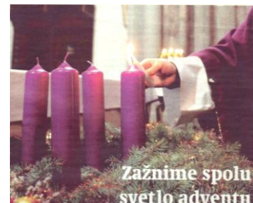
Zažnime spolu svetlo adventu

Dajme si do nového cirkevného roku predsavzatie, že s nádejou budeme očakávať Pána a na jeho príchod sa budeme pripravovať úprimnou modlitbou a prácou pre blaho blížnych. Nech o tom svedčia naše skutky už v nasledujúcom týždni.