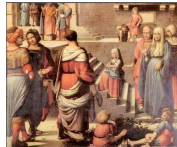
Obetovanie Panny Márie

Zakončím modlitbou sv. Františka: „A my ti ďakujeme, že ako si nás stvoril skrze svojho Syna, tak si taktiež chcel skutočnou a svätou láskou, ktorou si nás miloval, aby sa on narodil ako pravý Boh a pravý človek z Preslávnjej, Najblahoslavennejšej vždy Panny svätej Márie a že si nás zajatcov, chcel vykúpiť jeho krížom, jeho krvou a jeho smrťou. A ďakujeme ti, že tento tvoj Syn príde zasa v sláve a velebnosti, aby zvrhol do večného ohňa zavrnutých, ktorí nečinili pokánia a teba neuznali; a všetkým, ktorí ťa uznali, klaňali sa ti a v pokání ti slúžili, aby povedal: „Podťe, požehnaní môjho Otca, ujmite sa kráľovstva, ktoré je vám pripravené od založenia sveta.“