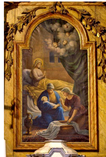
Narodenie Panny Márie Farnosť Šipice 2.polovica 14.storočia

No nestačí vyjaviť svoje vnútro iba človeku; je ho potrebné vyjaviť i Bohu. Hovorme teda v modlitbe Ježišovi o tom, čo nás trápi. Kedykoľvek budeme schopní Ježišovi vyjaviť svoje vnútro, začíname nastupovať na cestu k vnútornému uzdraveniu.