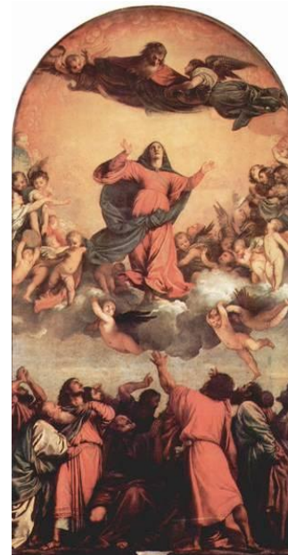
Tizian: Basilika Sancta Maria Gloriosa V Benátkach

Povedal Boh vo svojej svätyni: - Zajasám, Sicheť rozdělím, údolie Sukot rozmeriam. Mne patri Gileáa i Menaše, Efrajim je mi prilbou na hlavu a Júda žezlom v ruke. Moáb je mojím umývadlom, na Edome si obuv pohodím, nad Filištínmi víťazom sa stanem.