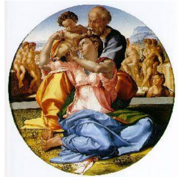
Michelangelo: Svätá rodina

Pod ochranou Panny Márie začíname Nový rok. Dnešný deň je dňom nádejí, očakávaní a prosieb. Sľúbme Panne Márii, že sa k nej budeme nielen modliť, ale ju aj nasledovať v jej životných postojoch. Potom aj my nájdeme to, čo našla ona: „milosť u Boha“ (Lk 1, 31).