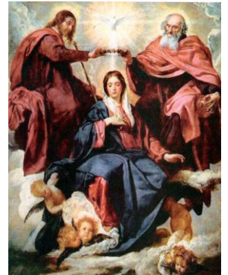
Diego Velázquez (1599-1660) Koronácia Panny Márie

My totiž nie sme povinní zhršíť. Nemôžeme zabrániť, aby nám nad hlavou lietali vtáci, nemusíme im však dovoliť, aby si v našich vlasoch urobili hniezdo. Sme zodpovední za to čo urobíme. Apoštol Jakub (1,14-15) píše, že každý kto je v pukušení, je zvädzaný vlastnou žiadostivosťou, ktorá ak je jej vyhovené, počne a porodí hriech. Satan zavolá do našej padlej prirodzenosti a žiadosti v nás sa rozozvučia. Že sa v nás objavia rôzne prirodzené túžby, to ešte nemusí byť zlé. Naše fyzické potreby a túžby sú dobré, krásne a majú byť naplnené, na to ich totiž Boh stvoril. Ale to sa deje vtedy, keď ich používame a usmerňujeme podľa správneho a krásneho cieľa, ktorý im dal Stvoriteľ. Vtedy môžeme skrze ne nádherne vychutnať život. Ak však začnú ony na popud zlého ovládať nás, stanú sa z nich zlé žiadosti, ktoré nás ničia. Ide teda o to, či oni ovládajú nás, alebo my ich.