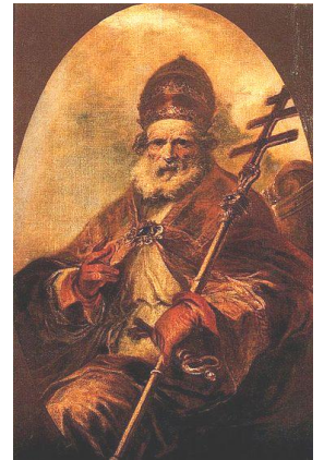
Pápež Lev Veľký 440-461