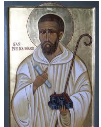
Svätý Peter Damiani, biskup