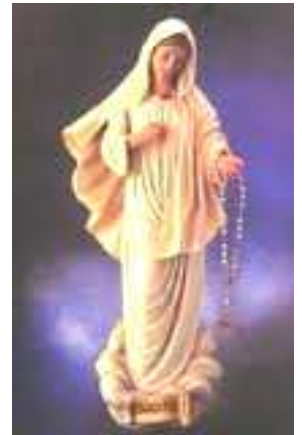
Ružencová Panna Mária