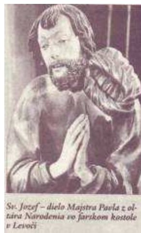
St. Jozef - dielo Majstra Pavla z ol-tára Narodenia vo farskom kostole v Levoči

Spoločenstvo pri farskom kostole Najsvätejšej Trojice vo Vištuku