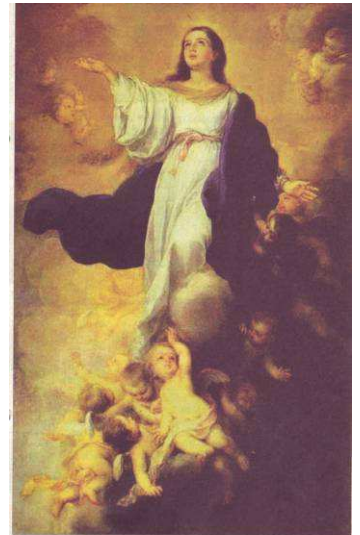
Bartolomé Esteban Murillo: Nanebovzatie (1670); Ernstedt, Petrohrad

Poznáš evanjeliové podobnenstvo o talentoch? - Ak nie, vyhládaj si ho u Matúša (Mt 25, 14-30). Každý z nás dostal čo-to. Jeden dostal silné svaly, druhý mimoriadnu pohyblivosť, jeden bystrú pamäť, iný presný úsudok, tento umelecké vlohy, tamten obchodného ducha. Jeden viac, druhý menej. A všetci raz budeme vydávať prísny počet z toho, ako sme s prijatými hrivnami šafáril. Kto mnoho dostal, mnoho sa bude od neho požadovať. A beda tomu, kto vráti len toľko, koľko prijal... Preto znovu treba zopakovať: „Práca, práca, práca!“ Veď len ňou možno zveladiť prijaté talenty. Sám sebe som si záhadou. Sú vo mne možno ešte dosiaľ neuvolnené energie, driemajúce sily, nepoznané vzácne vlastnosti, ktoré som dostal od Boha. Tieto treba objaviť, zobudiť, dať do pohybu, využiť ich na česť Božiu, pre dobro svoje a svojich bližných. Len práca motivovaná láskou k Bohu a k človeku zmobilizuje, rozvíja a zharmonizuje celý tvoj duševný a fyzický aparát. Topánky sa užívaním derú, schopnosti sa užívaním zveľadujú. - A keby si sa raz aj zvalil od prílišnej práce, nebanuj. Ak bola rozumne regulovaná a úmerná cieľu, nemáš si čo vyčítať. Ver, pravdu mali starí Rimania, keď tvrdili: „Je lepšie zodrat sa ako zhrdzavieť.“ Ale nezabudnime len tá práca je rozumná z ktorej niečo máme a najrozumnejšie je robiť tú prácu a pracovať tak, aby sme získali najviac... A to je vtedy keď pracujeme pre Boha a pre Božie kráľovstvo. On sám nás najbohatšie odmeni.