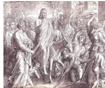
RESPONZÓRIOVÝ ŽALM 21, 8-9.17-18a. 19-20.23-24