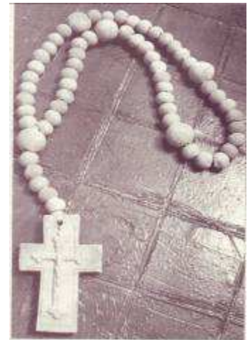
Kráľovná posvätného ruženca

Uverme v Božiu lásku a dobrotu a skúsme prežiť toto tajomstvo nášho osobného vzťahu s Bohom v našom chráme i v našom srdci.