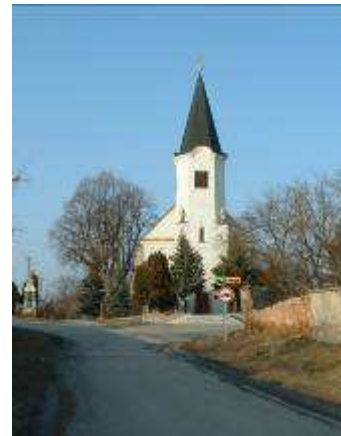
Kostol Najsvätejšej Trojice vo Vištucku

Pápež upozornil mladých, že aj keď je dom postavený na skale, neznamená to, že neprídu životné skúšky. „Kristus nesľubuje, že na rozostavaný dom sa nikdy nespustí lejak, nesľubuje, že ničivá vlna neprevráti to, čo je pre nás najdrahšie, nesľubuje, že prudké vetry neodnesú preč to, čo sme postavili, niekedy za cenu obrovských obetí. Kristus chápe nielen snahu človeka mať trvalý dom, ale naplno si uvedomuje aj všetko to, čo môže zničiť šťastie človeka. Nedivte sa preto nad ťažkosťami, akékoľvek sú! Nenechajte sa pre ne znechutiť! Budova postavená na skale nie je budovou, ktorá je uchránená pred prírodnými silami, zapísanými v tajomstve človeka. Postaviť na skale znamená uvedomovať si, že v ťažkých chvíľach je tu sila, ktorej môžeme dôverovať.“