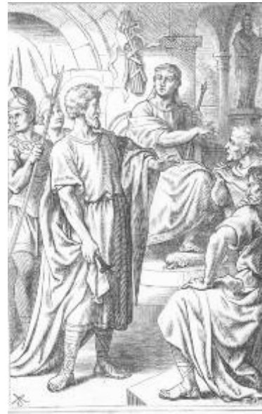
Sv. Apollonius, mučeník.

Rozšafný rímsky senátor Apolónius sa od istého času zmenil. Zostal oveľa pokornejším, láskavejším a v senáte spravodlivejším. Kolegovia sa čudovali, ale príčinu neobjavili. Až Apoloniov sluha Severus ju prezradil.