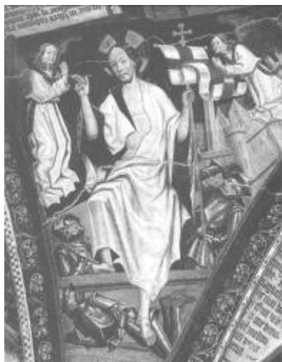
Nást.mal'ba z 15.stor.Brixen, Rakúsko

Nech zmŕtvychvstalý posilní Vašu vieru, povzbudí Vašu nádej a roznieti Vašu lásku.