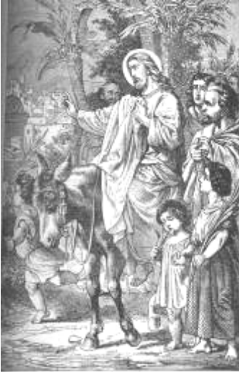
Svätoštvrtý vchod Ježišov do Jeruzalema.

- čiže Nedeľa utrpenia Pána je deň, v ktorý si pripomínáme ako Pán Ježiš vstúpil do Jeruzalema na osliatku. Vtedy ľudia nadšene kričali: „Hosana.“ A takto by sme v duchu viery mali kričať aj my. Privítať nášho Pána, ktorý nás prichádza vykúpiť. Bez Jeho obety by sme boli navždy stratení, ale toto vykúpenie má pre nás obrovskú hodnotu. Boh