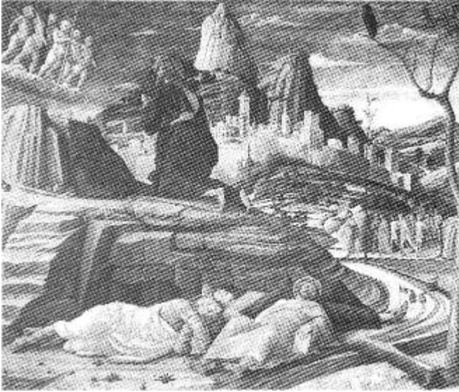
Andrea Mantegna: Premenenie Pána