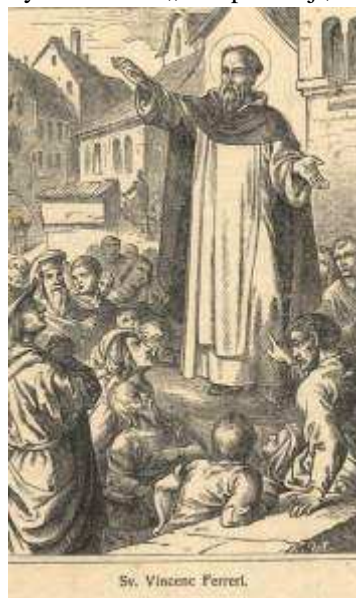
Sv. Vincenc Ferreri.

Sv. Vincent, vzdelaný a múdry pedagóg, učil vo Valencii na viacerých školách Raz bol svedkom sporu svojich študentov o to, čo je dôležitejšie pre vzdelanie. Jedni tvrdili, že talent, iní, že usilovnosť. Hádka bola ostrá, chlapci sa presvedčali krikom a záplavou slov. Vincent sa nepozorovane vzdialil. Na najbližšej hodine začal svoj výklad takto: „Chlapci moji, ak túžite dosiahnuť úspech vo