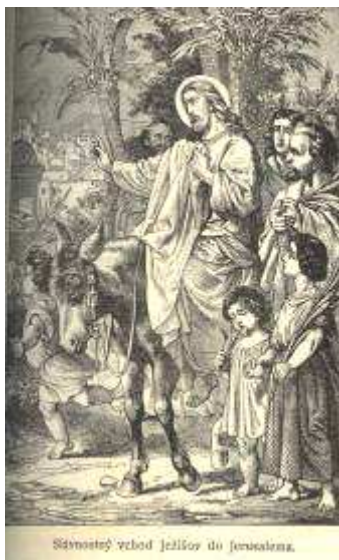
Slávnostný vchod Ježišov do Jeruzalema.

- čiže Nedeľa utrpenia Pána je deň, v ktorý si pripomínáme ako Pán Ježiš vstúpil do Jeruzalema na osliatku. Vtedy ľudia nadšene kričali: „Hosana.“ A takto by sme v duchu viery mali kričať aj my. Privítať nášho Pána, ktorý nás prichádza vykúpiť. Bez Jeho obety by sme boli navždy stratení, ale toto vykúpenie má pre nás obrovskú hodnotu. Boh nám odpúšťa hriechy aj vinu a dáva nám nový život. „Potrebujem aj ja vykúpenie, odpustenie hriechov? V čom cítim svoju najväčšiu vinu?“