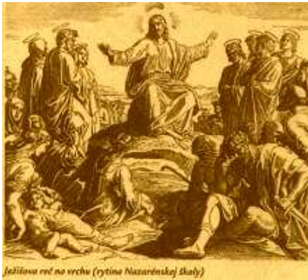
Ježišova reč na vrchu (rytina Nazaretskej skaly)

Blahoslavenstvá v prvom rade ukazujú na podstatný rozdiel pohľadu a hodnotenia života. Záleží, na ktorú stranu sa postavíme: na stranu Božieho pohľadu na život, či pozície sveta. Blahoslavenstvá sú kritériá na blaženosť – šťastie, radosť a pokoj v Duchu Svätom, nie podľa ducha sveta. Ukazujú,